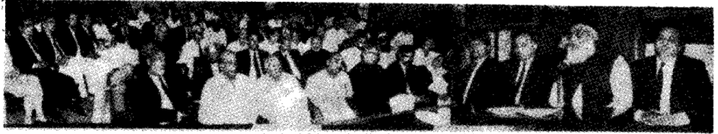
لاہور بلیک بورڈ بار ایسوسی ایشن کے زیر اہتمام ایک تقریب سے داعی تحریک خلافت پاکستان خطاب کرتے ہوئے

ابو نعیمی (نامہ نگار) امیر تنظیم اسلامی د داعی تحریک خلافت پاکستان ڈاکٹر اسرار احمد کے متحدہ عرب امارات میں داخلے پر ابو نعیمی حکومت نے پابندی لگا دی۔ ڈاکٹر اسرار احمد لندن میں خلافت کانفرنس میں عرب بادشاہوں کی عیاشیوں منقذہ عالی خلافت کانفرنس میں شمولیت کے بعد اور شاہ خزیچوں کو واضح کیا اور انہیں امریکہ کا ابو نعیمی کے لیے روانہ ہوئے تو ابو نعیمی حکومت واضح کر دیا۔