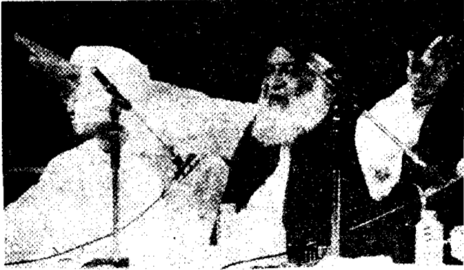
نظام خلافت کا نائب عالمی ہوگا ڈاکٹر اسرار احمد

ایٹم بم کی موجودگی کا حکومت کو کھل کر اعتراف کرنا چاہیے۔ اعتراف سے قوم میں خود اعتمادی کا جذبہ پیدا ہوگا