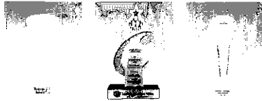
Brands of the Year Award 2008